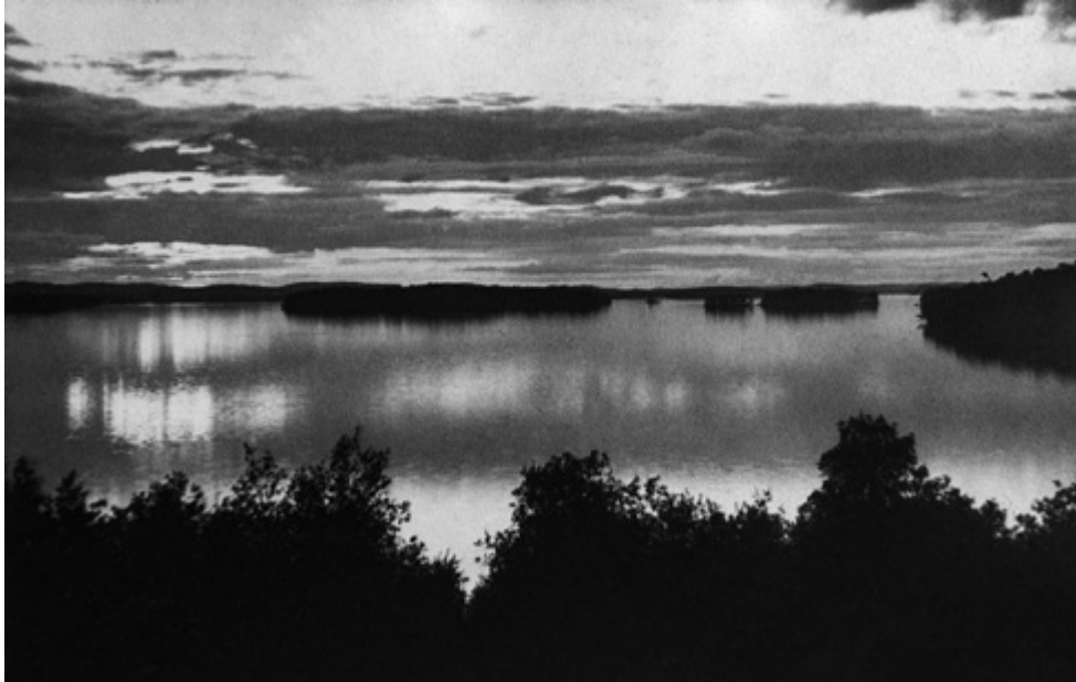
Simpelejärvi, Koitsanlahti, Parikkala (1932).