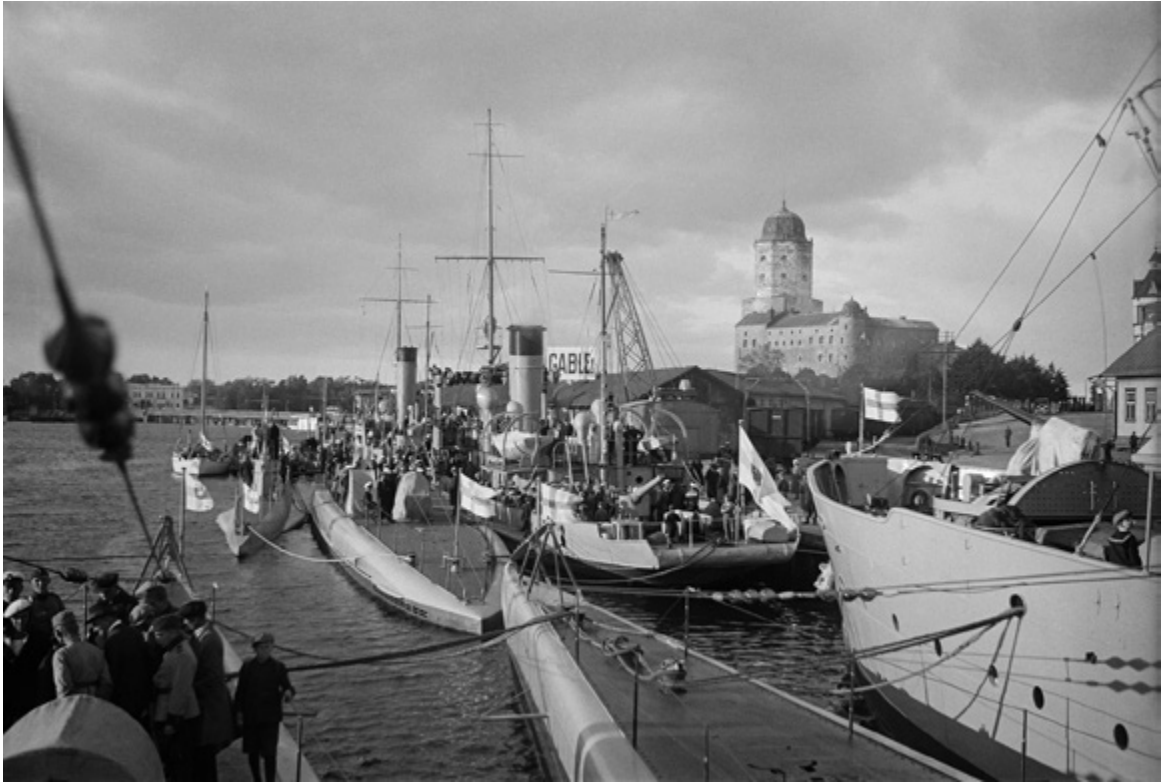
Viipurin satama (1930-luku).