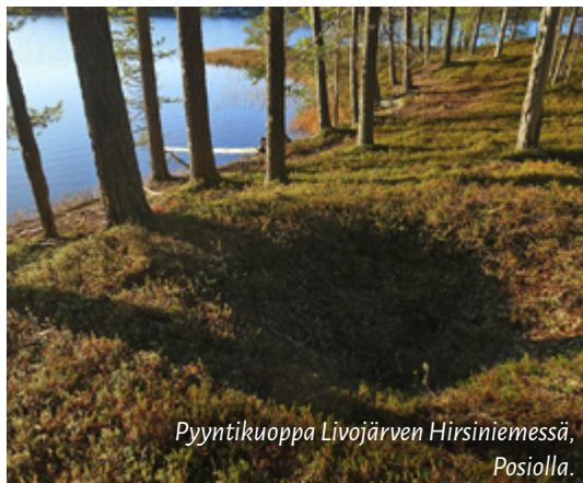
Pyyntikuoppa Livojärven Hirsiniemessä, Posiolla.

Saamelaiset ovat maamme alkuperäiskansa. Saamelaisia, tai kuten heitä aikanaan kutsuttiin, lappalaisia, asui joka puolella Suomea. He elivät liikkuvaa nomadin elämää metsästäen, kalastaen ja keräillen. Peuranpyyntikuoppia kutsutaan kartoilla paikoin lapinhaudoiksi ja jokiin rakennettujen puisten kalanpyydysten jäänteitä lapinpadoiksi (esimerkiksi Iso-Palosen–Maariansärkkien alueella, s. 69). Pikku hiljaa suomalaiset levittäytyivät etelästä kohti pohjoista ja työnsivät saamen kansan tieltään yhä pohjoisemmaksi. Suomalaisetkin metsästäivät ja kalastivat, mutta elinkeinopäletissa oli tärkeintä maan-