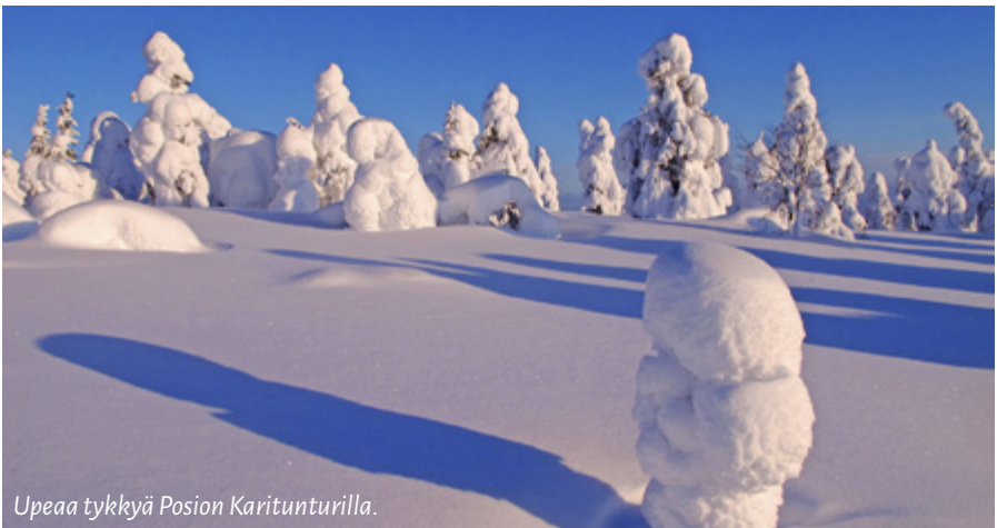
Upeaa tykkyä Posion Karitunturilla.

Talvella lumi tallentaa eläinten jäljet ihmisen ihasteltaviksi ja ihmeteltäviksi. Hankien aikaan pääsee näkemään esimerkiksi ahman, suden, ilveksen, saukon, hirven, näädän, ketun, jäniksen, metson, teeren, riekon ja pyyn jälkiä. Metsäpeuran talvehtimisalueilla