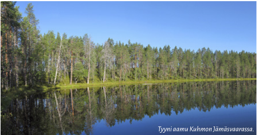
Tyyni aamu Kuhmon Jämäsvaarassa.

Samanlaista koskemattoman erämaan laajuutta kuin pohjoisimmassa Lapissa alueella ei sentään ole. Aarnimetsät ja luonnontilaiset suot ovat vain osa maise-