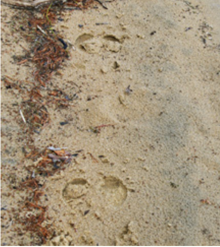
Metsäpeuran jäljet Lentuaalla.

voi huomata peuran jälkiä ja poronhoitoalueen puolella eli Ylä-Kainuussa ja Koillismaalla näkee tietenkin poroja ja niiden jälkiä.