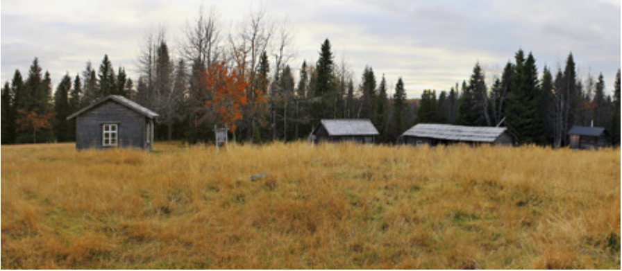
Erämaatilat perustettiin usein vaaran laelle, jossa hallan vaara oli pienempi. Rytivaaran tila Syötteen kansallispuistossa on aivan vaaran laella.

merkiksi Riisitunturilla (s. 277), Korouomas- sa (s. 272) ja Vienan reitillä (s. 153). Syötteel- lä (s. 203) on myös entisestä niittysaunasta kunnostettu autiotupa.