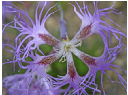
Pulskaneilikka Oulankajoen varressa.

Nummikellokanervaa kasvaa Suomessa vain Kuhmossa, kangasraunikkia puolestaan lähinnä vain Kuusamossa. Oulangan kansallispuisto on todellinen erikoisten