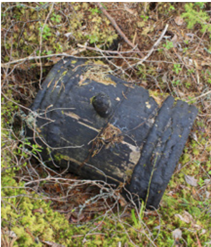
Tervätynnyri tervahaudan halsin alapäässä. Kupson kutsu.

Jatkosodasta puolestaan jäi hyvin erikoislaatuinen sotahistorian muisto: Hyrynsalmelta Suomussalmen Pesjön kautta Taivalkoskelle ja edelleen Kuusamoon johdettu sodanaikainen, vankityövoimalla rakennettu kapearaiteinen rautatie, kenttärata (katso tietolaatikko sivulla 222).