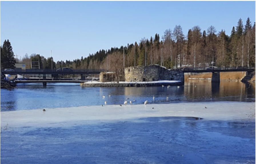
Kajaanin linnanraunio on yksi Renforsin lenkin nähtävyyksistä.

Talvisodan ankaria, autenttisia taistelupaikkoja näkee Suomussalmen Raatteen portin polustojen (s. 160) ja Kuhmon Kilpelänkankaan retkipolun (ei esitelty kirjassa, koordinaatit N 7091150, E 656620) varsilla. Kuusamon Lahtela–Vanttajan polun (s. 235) varressa on hyvät tietotaulut ja vielä näyttävämpiä puolustuslaitteita, kuten entisöityjä juoksuhautoja, konekivääripesäkkeitä, korsuja sekä panssariestettä. Täällä ei lopulta taisteltu, mutta Salpalinja oli oleellinen osa Suomen itsenäisenä säilymistä. Syvänperänsärkällä (s. 162) on ehkä erikoisin Talvisodan muistomerkki: karsikkopuu.