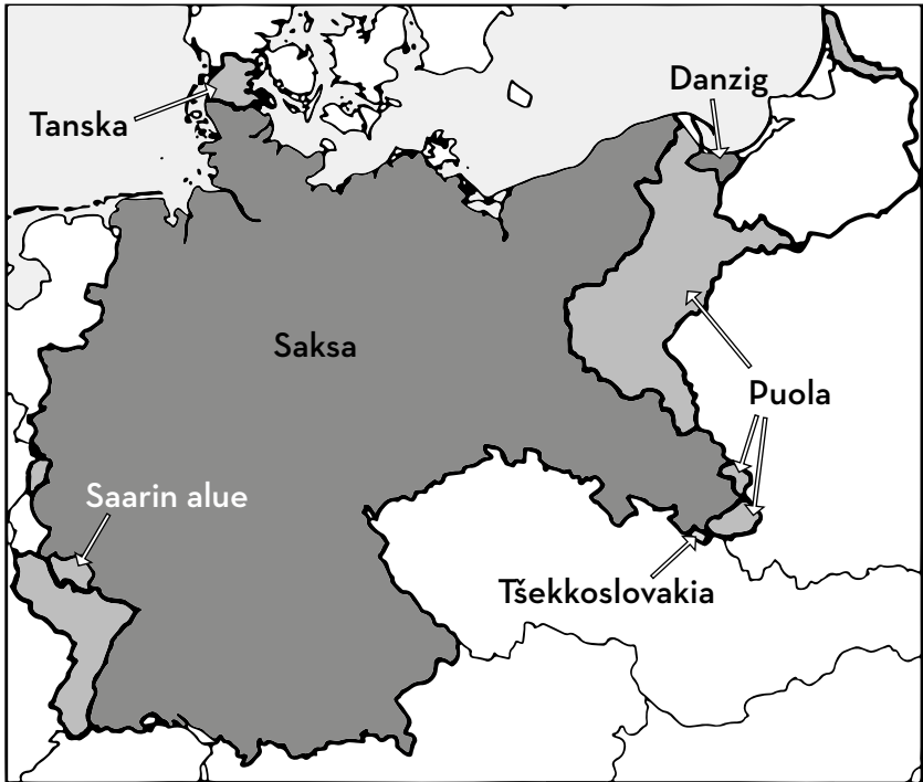
Saksan 1. maailmansodan jälkeen menettämät alueet merkitty vaaleanharmaalla.

miljardia, ja huhtikuussa tehtiin lopullinen päätös 132 miljardin kulta-markasta, mutta jälkimmäinenkin luku oli Saksalle silti tähtitieteellisen korkea. Yhdysvalloissa ennustettiin valtaviin sotakorvausten johtavan Saksan talouden romahdukseen, eikä se hyväksynyt koko sopimusta. Yhdysvallat ja Saksa solmivat erillisrauhan elokuussa 1921.