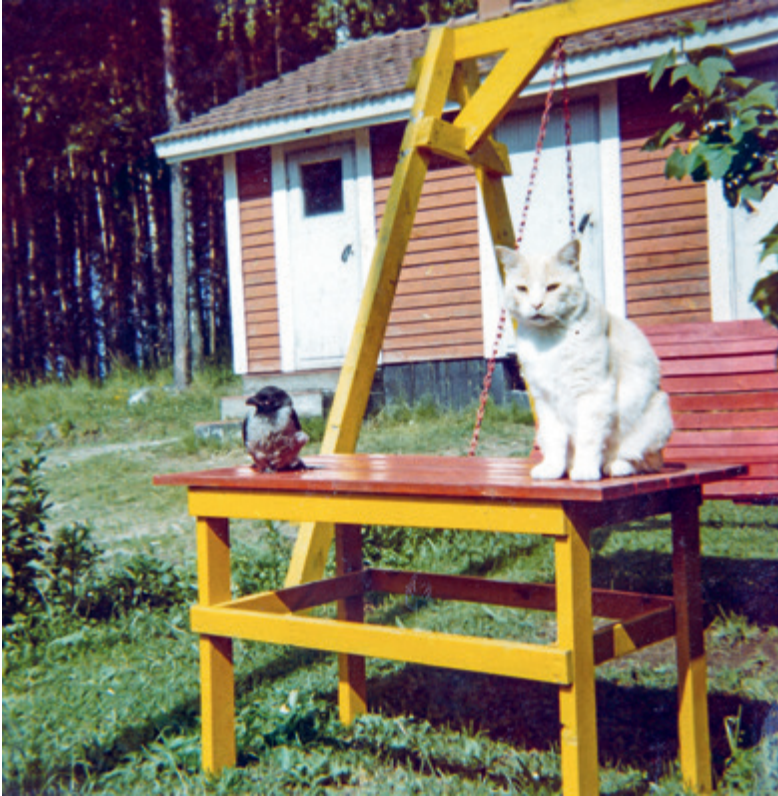
Kepposia tehtäillut Ville-varis ja kissamme Kisu sulassa sovussa Närsäkkälän rajavartioaseman pihamaalla joskus 1970-luvulla.

kyisin kun kommentoin somessa karhujen ja susien puolesta, niin vastaukseksi tulee, että mitä sinäkin niistä tiedät kun asut kaupungissa. Kyllä minä niistä jonkun verran tiedän, sillä asuin lapsuuteni ja varhaisnuoruuteni maalla. Kun lapsena leikittiin Kiteellä pimeällä muiden lasten kanssa, niin ei tullut mieleenkään, että susi tulee ja syö minut. Mutta lapsuudesta tuli kimmoke, miten eläimiä pitää kohdella. Otinhan minäkin 10-vuotiaana Kiteellä harakanpoikasen pesästä lemmikikseni ja kasvatin sen. Kaiken kaikkiaan elämä Närsäkkälässä antoi hyvän kipinän tulevalle luonto- ja eläinharrastukselle.”