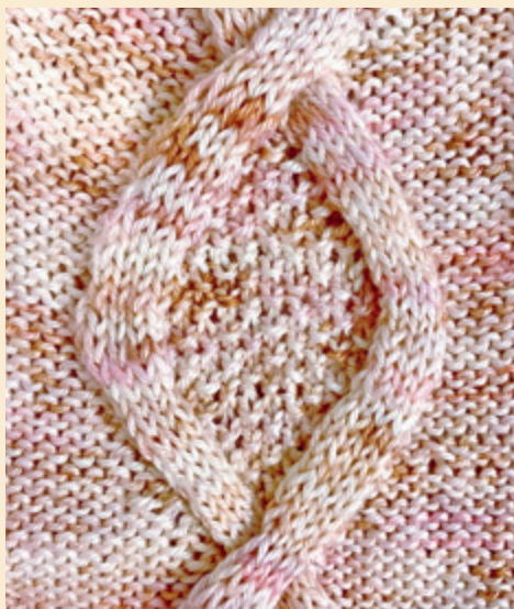
Lettikuvio, jonka sisään on neulottu helmineuletta Puuteriunelman (s. 111–117) ohjeissa.