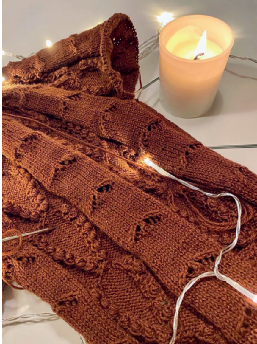
Kuvassa Choco Kiss -neuleen (s. 135–143) vartalo on neulottu ja seuraavaksi siirrytään neulomaan hihoja.

Neuleet voi helposti neuloa pidemmiksi, mikäli ne tuntuvat itselle liian lyhyiltä tai tarvitset esimerkiksi hihoihin lisää pituutta, mutta tämä pitää huomioida langan määrässä. Myös kaarrokkeen pituutta voi aavistuksen pidentää ja jatkaa kuviointia mallin mukaan. Olen mitoitannut näihin mallineulepuseroihin sopivan määrän lankaa, mutta pidennyksiä en ole laskenut lankamääriin mukaan. Parempi ostaa lankaa mieluummin liikaa kuin taistella liian vähäisen lankamäärän kanssa.