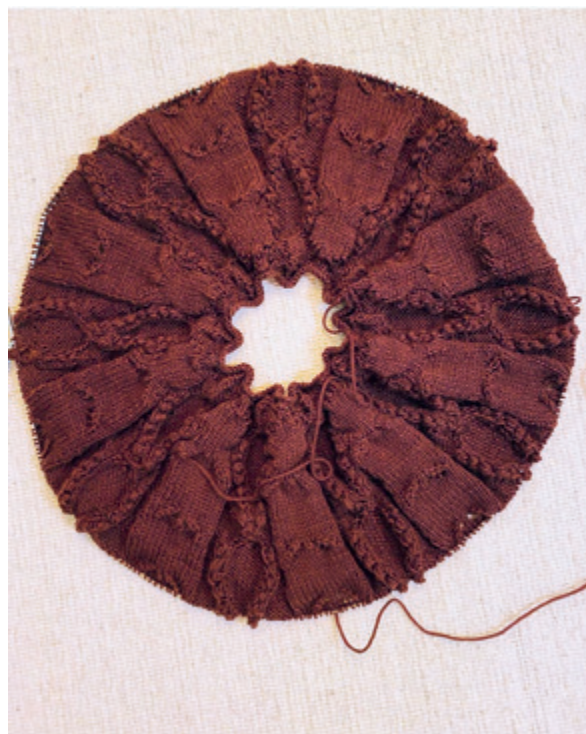
Kuvassa Choco Kiss -neuleen (s. 135–143) kaarroke, jossa lisäykset on tehty sileään oikein neuleen osioihin.

Ylhäältä alas neulotaan siis päinvastoin. Neulominen aloitetaan pääntieltä takaa niskasta suljettuna neuleena eli ympyränä. Heti alussa merkitään aloituskohta silmukkamerkillä keskelle taakse niskaan, ja tästä lasketaan myöhemmin silmukat, kun kappale