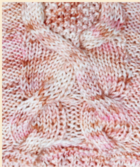
Puuteriunelman keskelle eteen sijoitettu lettikuvio.