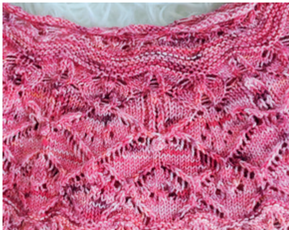
Kuvassa lyhennetyt kerrokset niskassa näkyvät aina oikein neuleena eli neulo oikea kerros, nurja kerros, oikea kerros jne.

Neulo 20 silmukkaa oikein, käännä työ nurja puoli itseesi päin, ota langankierto puikolle ja neulo 40 silmukkaa oikein tai nurin riippuen mallista, käännä työ oikea puoli itseesi päin, ota langankierto puikolle ja jatka näin neulomalla aina 20 silmukkaa enemmän, käännä työ ja toista ohjetta. Kun olet neulonut