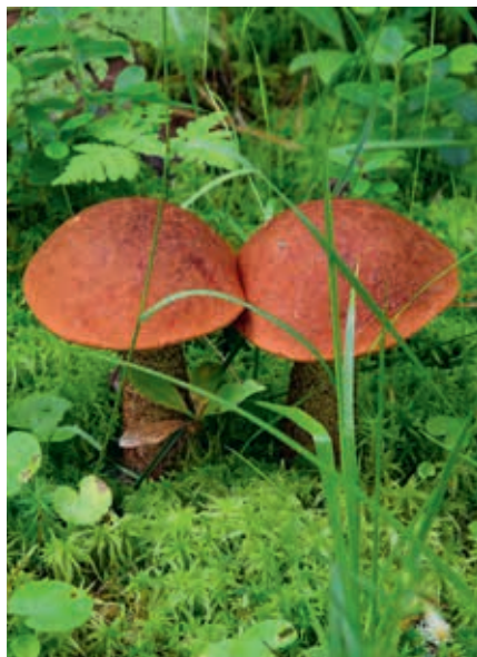
Sienestäminen kuuluu jokamiehenoikeuksiin.

Nuotion voi tehdä vain virallisilla nuotiopaikoilla, joita yleensä on kuntien ja kaupunkien ulkoilualueilla, virkistysalueilla, kansallispuistoissa ja joissain tapauksissa yksityishenkilöiden tai kyläyhteisöjen rakentamissa paikoissa. Vaikka metsästä löytyisi ennestään käytetty nuotiopaikka, kivikehä ja hiilet kehän pohjalla, ne eivät tee tulenteosta luvallista. Sen lisäksi on hyvä muistaa, että metsäpalovaroituksen aikana tulta ei voi sytyttää virallisillakaan nuotiopaikoilla. Silloin voi makkaransa grillata vain hormillisissa tulisijoissa, siis keittokatoksissa ja grillikatoksissa, joissa savupiippu johtaa savun ja kipinät taivaalle. Niinpä metsäpalovaroituksen vallitessa Onkimaanjärven virkistysalueella (katso s. 266) ja Iso-Valkeen luontopolun (katso s. 172) varrella nuotiota ei voi tehdä, mutta Koppanäsin virkistysalueen (katso s. 46) Väransbyn ulkoilualueen (katso s. 35) keittokatoksissa se on sallittua.