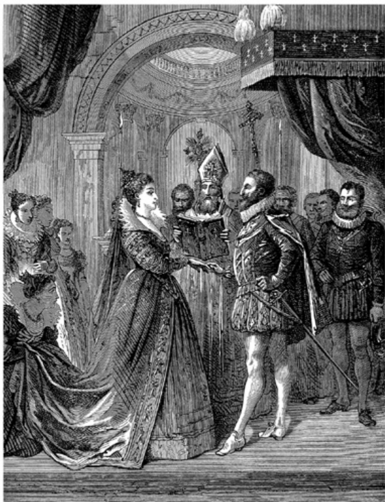
Ranskan kuningas Henrik IV avioituu Maria de' Medicin kanssa. Paavi oli vuotta aikaisemmin myöntänyt kuninkaalle eron kuningatar Margaretasta, koska tämä ei ollut synnyttänyt parille lasta.