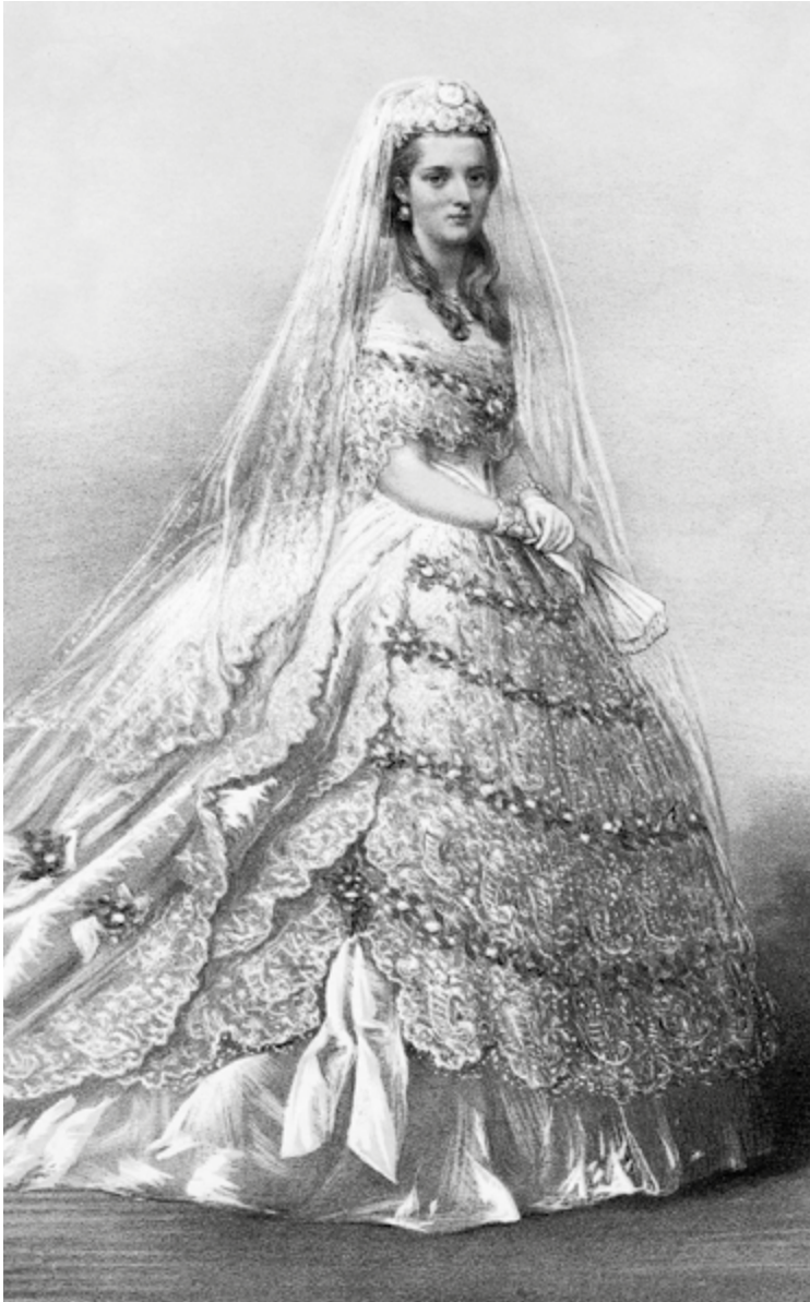
Tanskan prinsessa Alexandra avioitui vuonna 1863 Walesin prinssi Edvardin kanssa. Alexandra toi Tanskasta mukanaan itselleen suunnitellun hääpuvun, mutta Iso-Britanniassa paheksuttiin ulkomaista pukua ja vaadittiin, että kruununprinsessan on avioituttava uudessa kotimaassaan valmistetussa, kuvassa näkyvässä hääpuvussa.