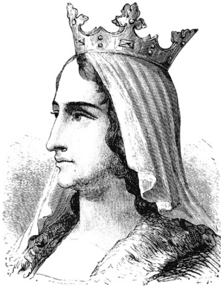
Kastilian kruununperillinen Isabella meni salaa ja omasta tahdostaan naimisiin Aragonian kruununperillisen Ferdinandin kanssa vuonna 1469. Liiton kautta syntyi Espanjan kuningaskunta.