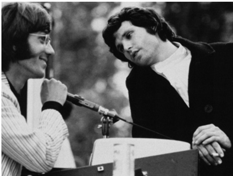
Jim Morrison ja Ray Manzarek soundcheckissä ennen konserttia. Molemmat miehet olivat älykköjä ja ymmärsivät hyvin toisiaan.

Doors esiintyi 1.5.1973 Pariisissa Olympia-teatterissa ehkä yhtyeen kaikkien aikojen koskettavimmassa konsertissa. Olin tuona vuonna Euroopassa Rolling Stone -lehden toimittajana ja matkus-tin Pariisiin konserttia varten. Katsomon kaksituhatpäisessä yleisössä nähtiin kyöneleitä lähes kaikkien kasvoilla. Moni ihmetteli, miksei kukaan Doorsin kolmesta jäsenestä maininnut Jimiä lainkaan koko illan aikana ja mikseivät he käyneet katsomassa Jimin hautaa seuraavana päivänä. Omien sanojensa mukaan yhtyeen jäsenet eivät käyneet haudalla, koska he pelkäsivät, että siitä olisi tullut epämiellyttävä kokemus suuren väkijoukon takia.