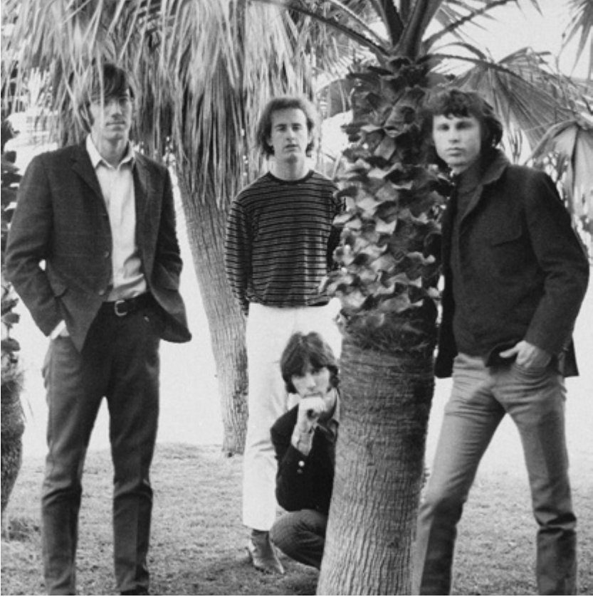
Doors Venicen rannalla vuonna 1966.

vajaa vuosi aiemmin. Tai ehkä hän vain joi liikaa alkoholia. Kaikki olivat yksimielisiä siitä, että kuolema ei voinut johtua heroiinista. Alkoholi oli Jimin päihde.