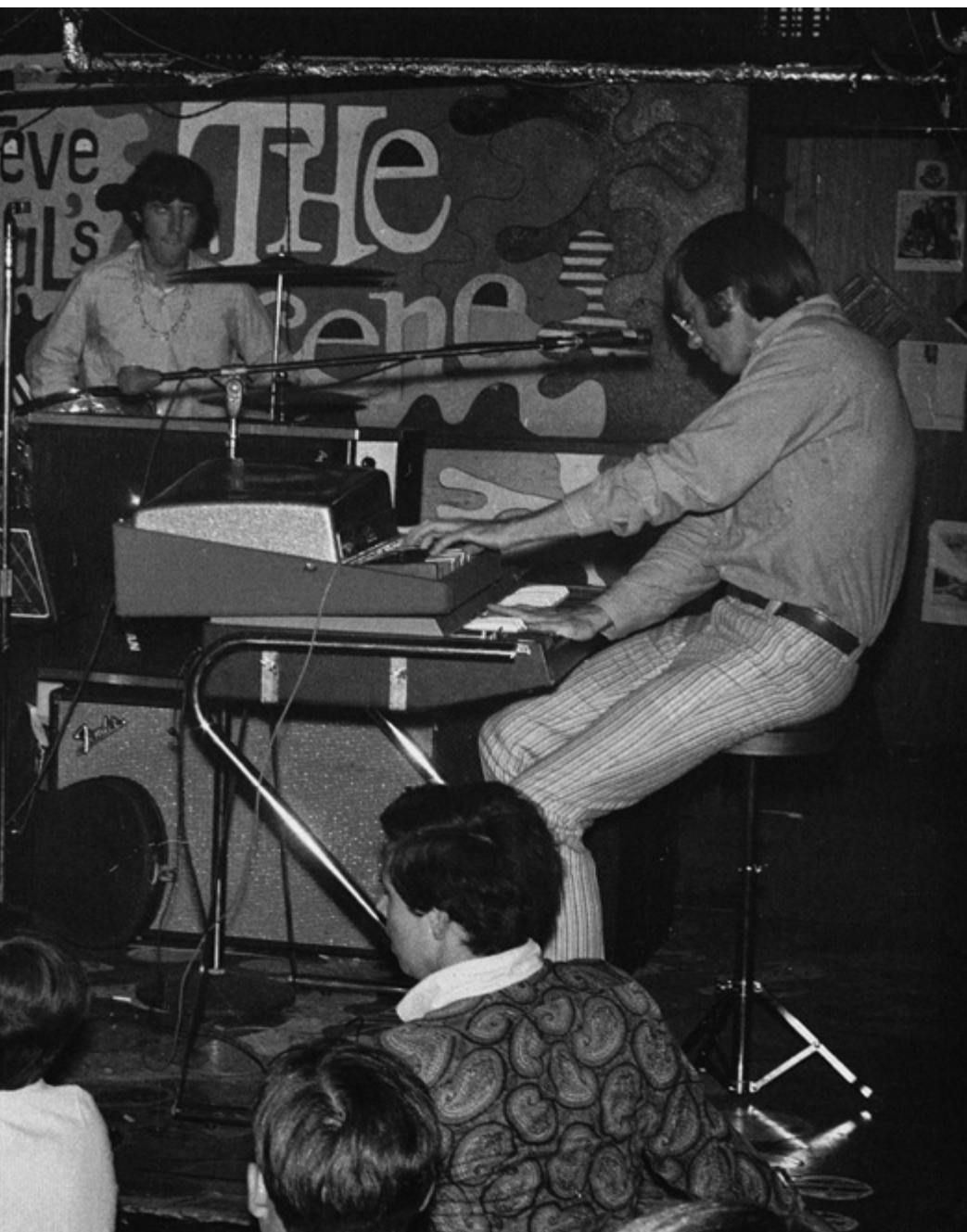
Doors esiintymässä pienellä bluesklubilla The Scene New Yorkissa.