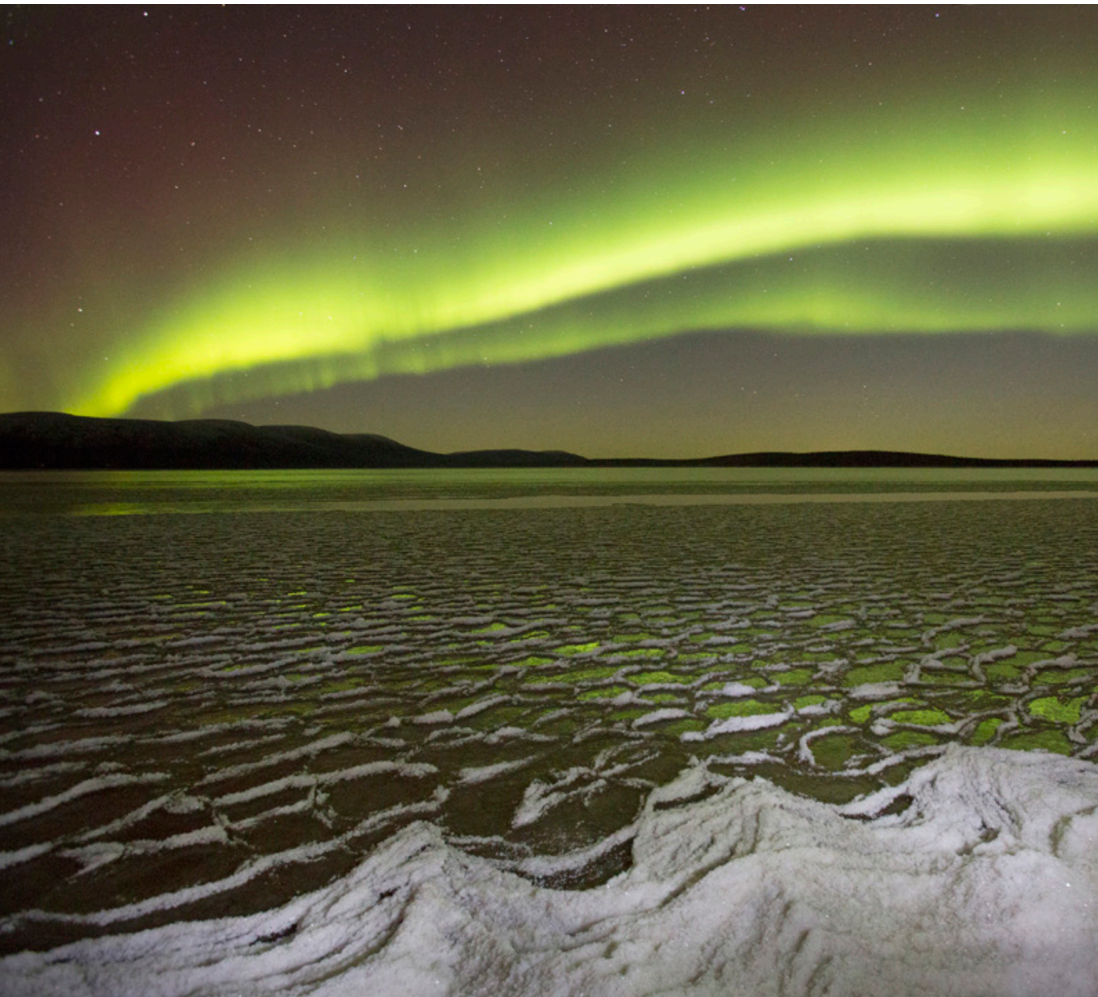
Yllä: Pallasjärven ensijäät marraskuun alussa. Oikealla: Nammalakurussa viihtyvät niin riekot kuin hiihtäjät.