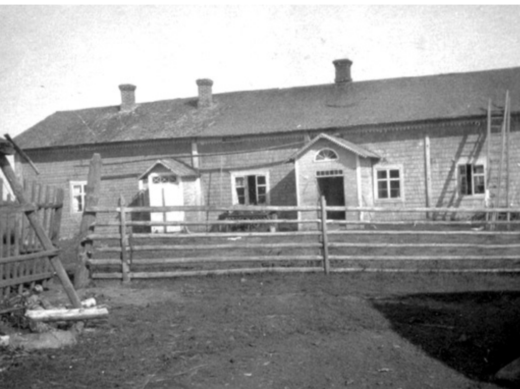
Unimäen vanhassa talossa oli pärevuoratut ulkoseinät. Talo oli rakennettu 1850-luvun vaihteessa ja se purettiin vuonna 1967.