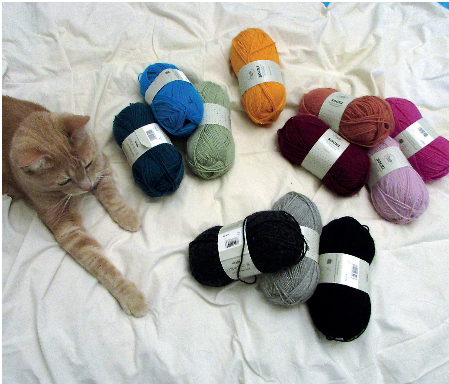
Pyro ja langat