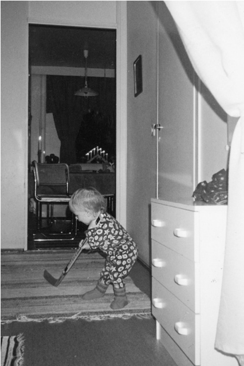
Peterillä pysyi maila kädessä jo yksivuotiaana. Kotilaisten perhealbumi