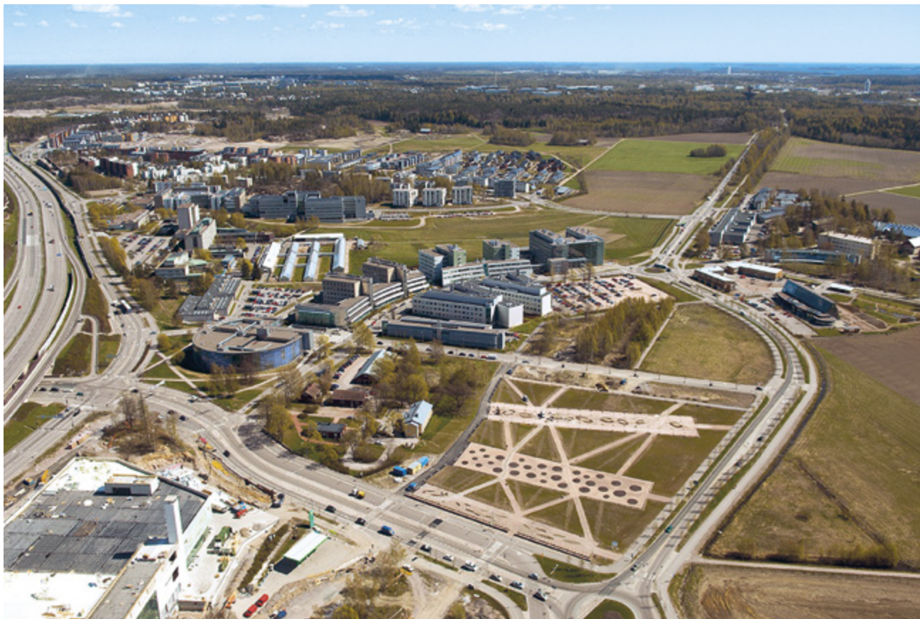
Viks forskarpark 2007.

Kunskapens metropol beskriver talrika skolor och läroanstalt, massmedier och forskningsanstalt, bibliotek, museer, bokhandlar och förlag. Händelser beskrivs utifrån vändpunkter och centrala aktörer inom olika områden. Verket är en personlig tolkning av effekterna av politisk reglering och förändringar i värderingar å ena sidan och av genombrott inom vetenskap och teknik å andra sidan. Tidsmässigt börjar skildringen från efterkrigsårens kulturkamp. 1960-talets värderevolution medförde centraliserad planering och tillväxten av den offentliga sektorns reglering. Inrättandet av regionala högskolor och statens teknologipolitik bröt Helsingfors universitets och Tekniska universitetets dominerande ställning. Grundskolan med jämställdhetstänkande revolutionerade Helsingfors mångsidiga skolsystem. Underhållning började ersätta utbildning inom media och bibliotek. Regleringen följdes av en gradvis avveckling på 1980-talet, upplösning av monopol och ökandet av konkurrenstänkande i livets alla sfärer. I slutet av verket beskrivs digitaliseringens effekter i Helsingfors. Kommunikationsnätverk skapade av dataöverföring, digital signalbehandling, spridningen av datorer och mikroprocessorernas kapacitetsökning samt internet öppnade nya banor för informationsinhämtning, bearbetning och distribution. Ett av teman inom kunskapens historia är även kommungränsernas utsuddning på grund av internet och tätt regionalt samarbete.