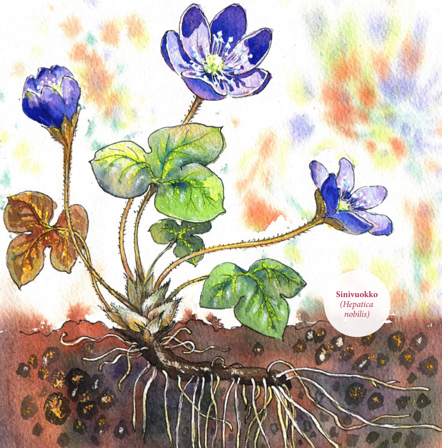
Sinivuokko ( Hepatica nobilis )