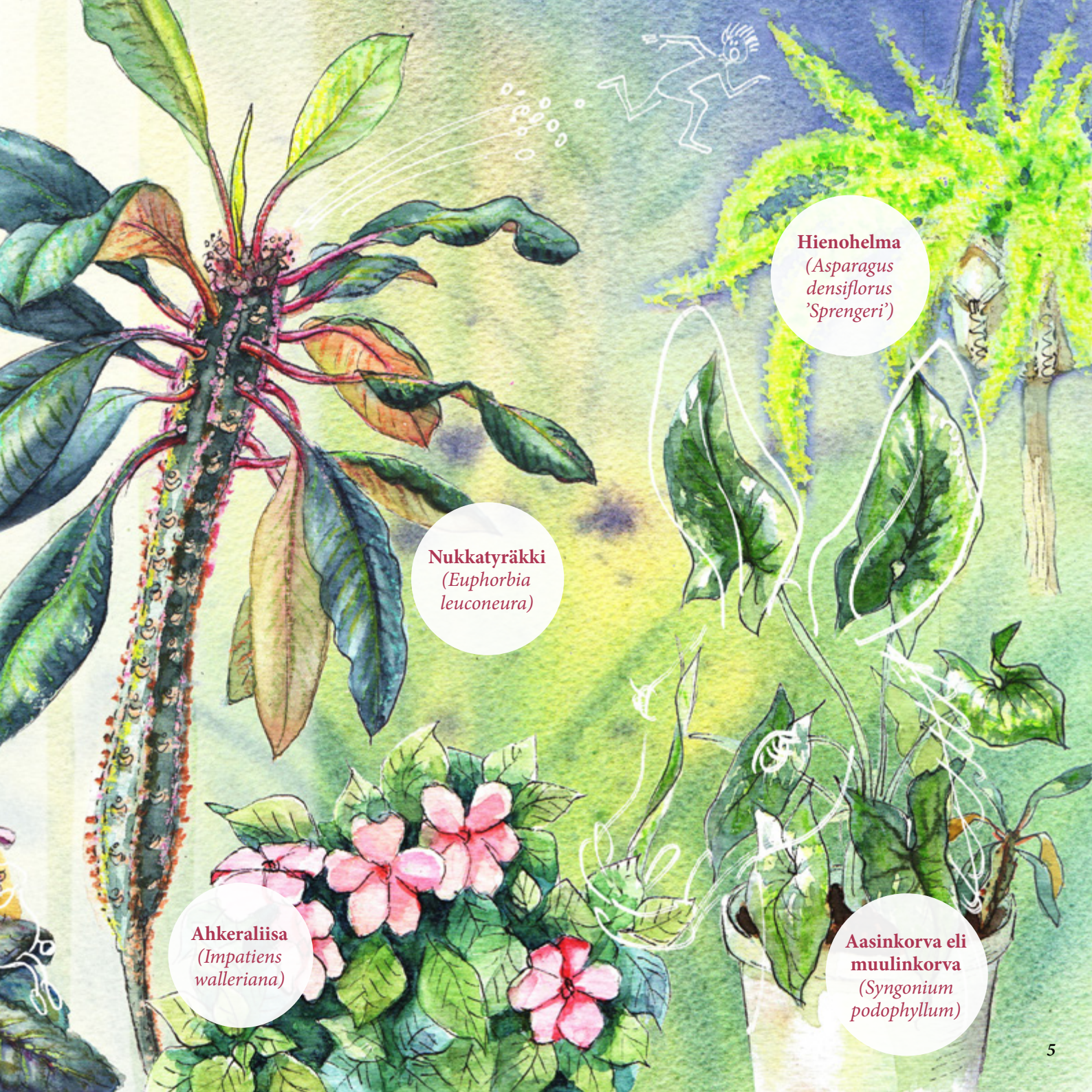
Hienohelma ( Asparagus densiflorus 'Sprengeri')