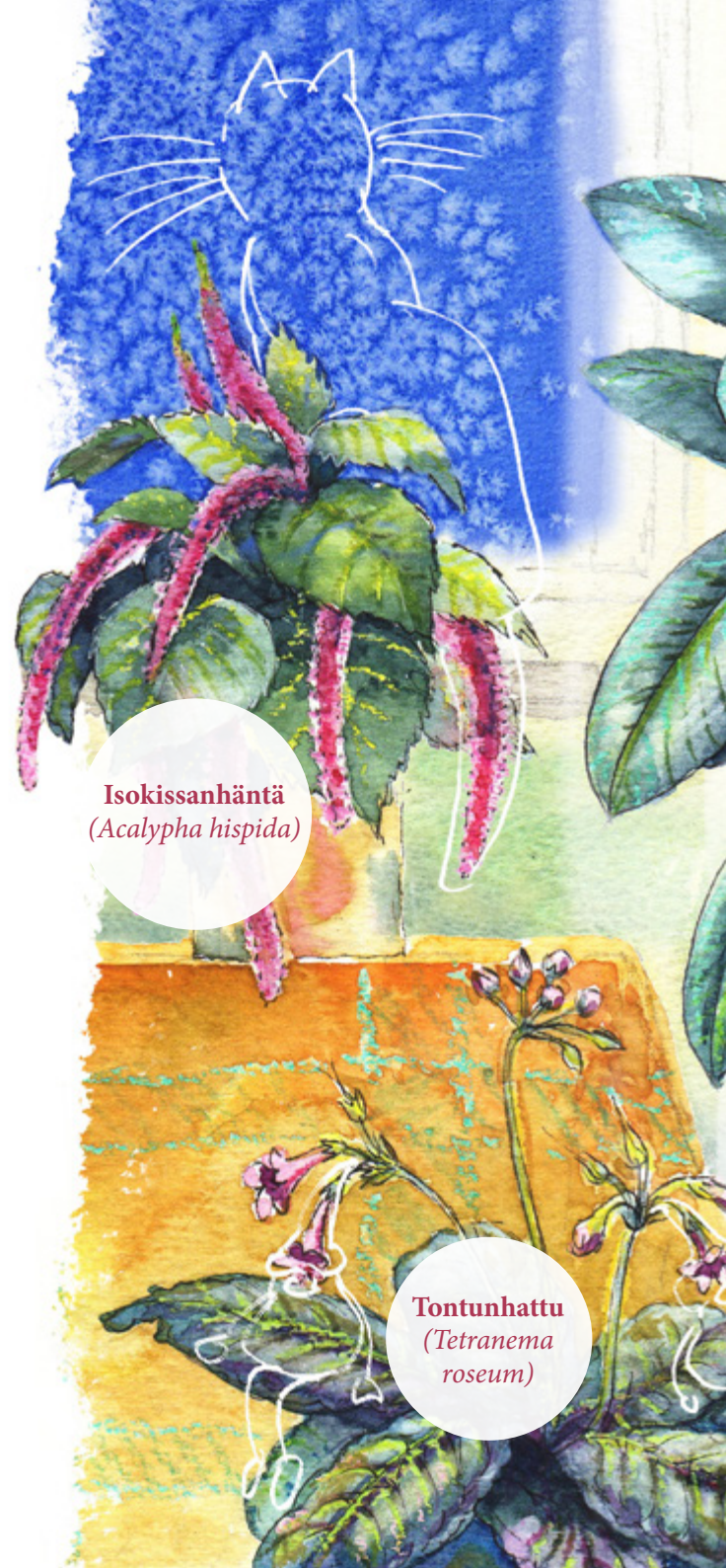
Isokissanhäntä ( Acalypha hispida )

Hassu nukkatyräkki ”ampuu” siemiensä ympäröivänsä. Naapurikasvin ruokkuun voikin yllättäen ilmestyä pieni tyräkinpoikanen.